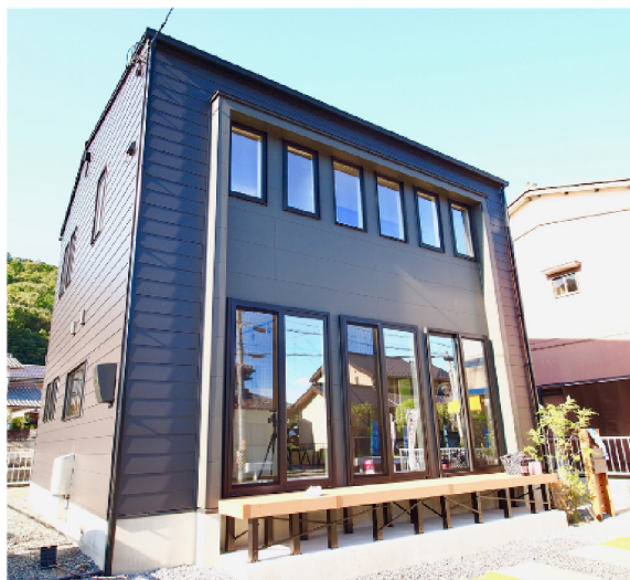
※同モデル写真です